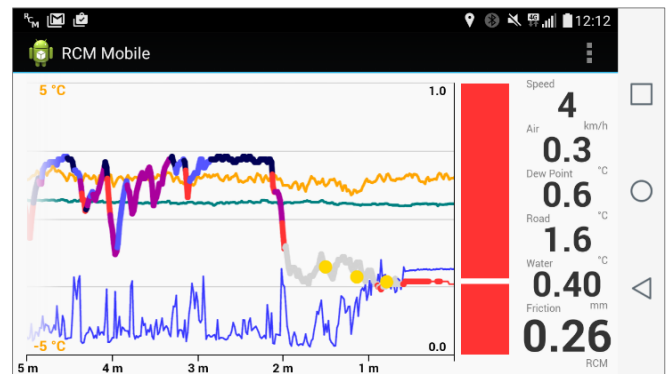
Capture d'écran de l'interface utilisateur avec les mesures de température et de l'état de chaussée.