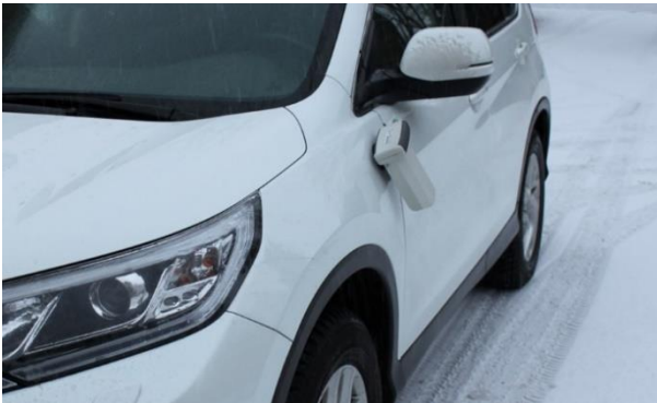
Installation facile sur la surface métallique du véhicule par montage magnétique.